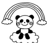
ばんだグループ (3~5歳児) 火曜日

令和6年度の親子グループの活動に参加される乳幼児親子さんを大募集!! 毎月3回程度、年齢別にリズム遊びや季節の製作遊びなどを行っています。また、全グループ合同の運動会や遠足なども予定しています。興味のある方はぜひ、見学にお越しください。