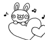
うさぎグループ (2歳児) 金曜日

♪令和5年度に引き続き参加される方も再度申し込みが必要です。申込み用紙は児童館にあります。詳しくは児童館までお気軽にお問い合わせください。