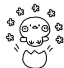
ひよこグループ (0, 1歳児) 水曜日